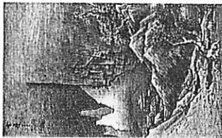
<C>雪舟の『秋冬山水図』(左)と夏珪の『溪山清遠図』(右)