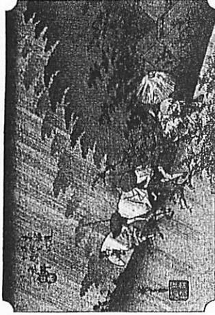
<D>安藤広重の『東海道五十三次』(左)とゴッホの『タンギー爺さん』(右)